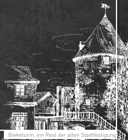
Bieketurm, ein Rest der alten Stadtfestigung