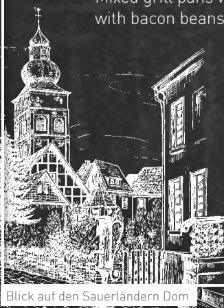
Blick auf den Sauerländern Dom