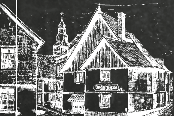
Niederste Straße vor 1945