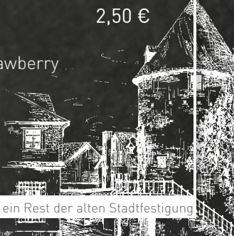
Bieketurm, ein Rest der alten Stadtfestung